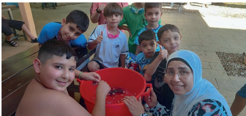
Kinder aus dem Shuafat Flüchtlingscamp mit der Al Quds Charitable Society am Frischwasserpool am Beit Noah.

Das ist nicht immer einfach! Denn neben all diesen schrecklichen Ereignissen gab es un-