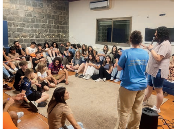
House of Light bildet neue „Leader“ aus.

bestritten weiterhin einen Alltag, ein Leben neben dem Krieg, und wir mussten alle uns immer wieder in Erinnerung rufen, dass das, was wir hier erleben mussten, nicht die Norm ist und sein darf.