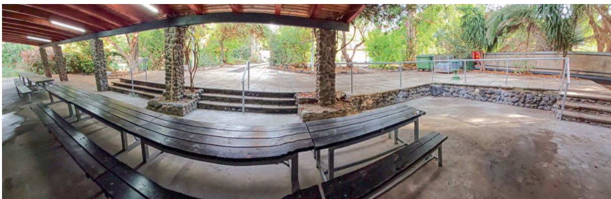
Das neue Geländer am Vorplatz des Beit Benedikt führt zu mehr Sicherheit.

So haben wir die Zeit genutzt, um uns vorzubereiten auf ein hoffentlich besseres, friedlicheres und freudigeres Jahr 2025!