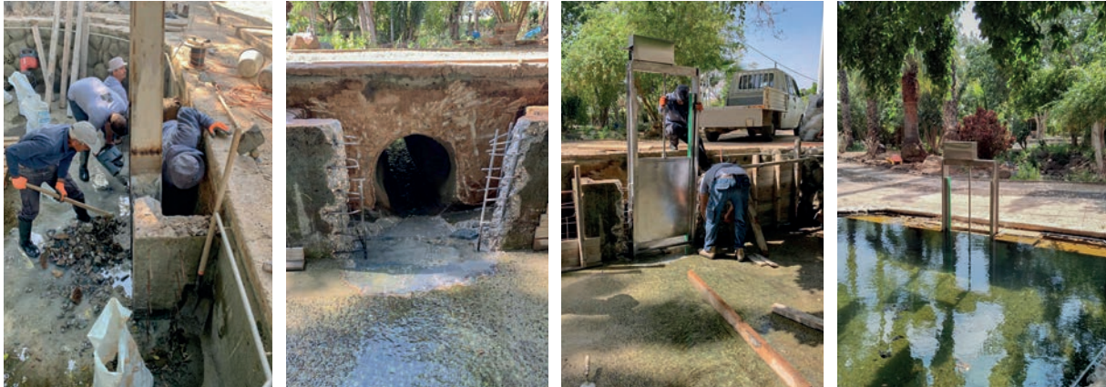
Die Stauvorrichtung des Pools wird erneuert.

Gruppe für das Beit Noah gewinnen. „Migdalor“ – Turm des Lichts – ist ein wunderbares Projekt, welches es sich zur Aufgabe gemacht hat, Menschen mit Sehbehinderung zu ermöglichen, auf Ihre Weise das Land zu erkunden und mit Hilfe von „Sehenden“ ausgiebige Wanderungen durchzuführen. Es war bewegend zu sehen, wie diese Menschen sich sofort bei uns zuhause gefühlt haben.