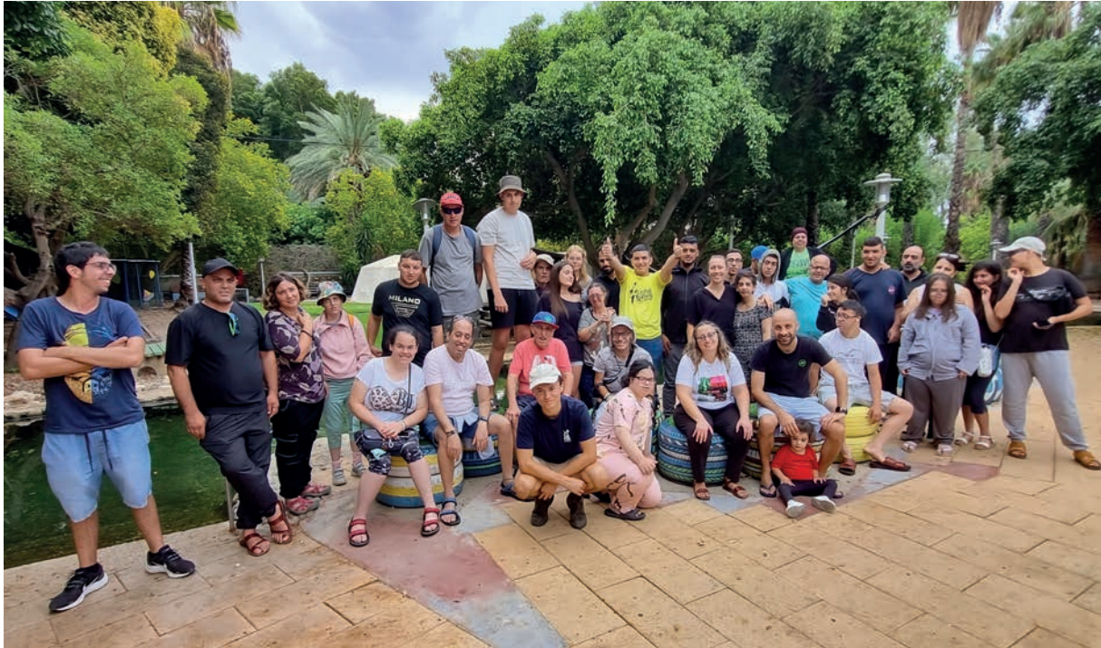
Die Begegnung der Gruppen von Lifegate und Kfar Tikva.