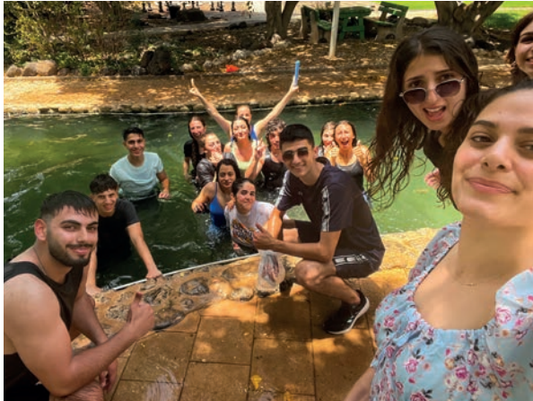
Wasser ist Leben!